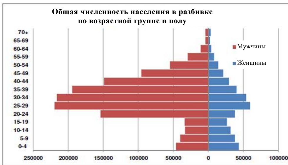
Рис. 1 Возрастная пирамида, 2010 год